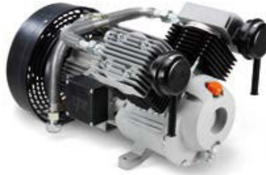
AIRKO 469 AIRKO 609