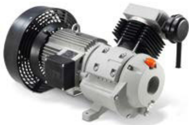
AIRKO 239 AIRKO 309